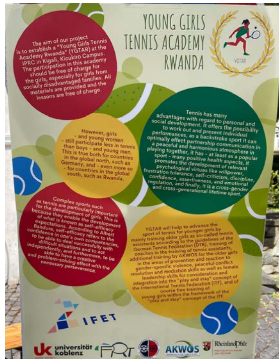
"Young Girls Tennis Academy Rwanda" (YGTAR)