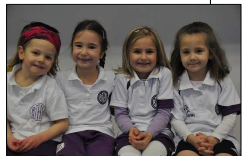
mit so charmanten Teilnehmerinnen,

Mit erfolgreichen Mannschaften, die so tolle Namen hatten wie „4 gewinnt“; „die schnellen Flitzer“, „Team Balou“ oder „Giraffen-Affen“ (wäre doch auch was für unsere 1., he?).