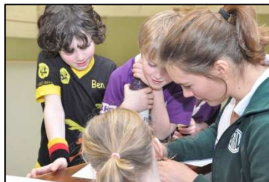
mit kompetenter Turnierleitung,