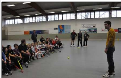
mit vielen netten Familien in der BTHV-Halle,

Für viele Spielerinnen und Spieler aus dem E-, D- und C-Bereich und ihre Geschwister, Eltern und z.T. auch Großeltern fing das neue Jahr schon toll an: