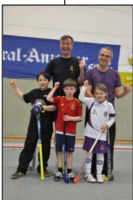
mit spannenden Spielen 4 gegen 4,