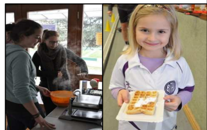
mit leckeren Waffeln und Punsch, Danke den 1. Damen!