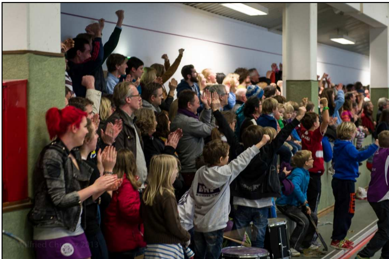
Und die Halle war voll!