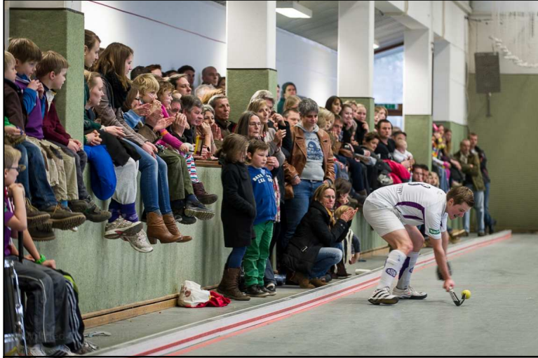
Die Stimmung war toll!

Was für eine Stimmung beim Abstiegsendspiel in der BTHV-Halle!