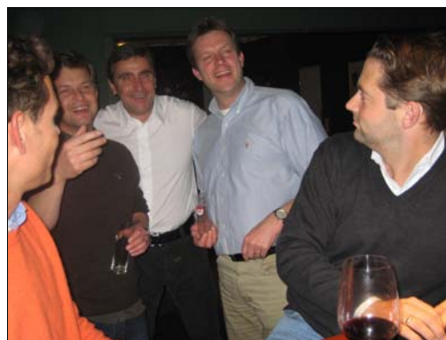
Bekannte Bonneproppen an der Theke