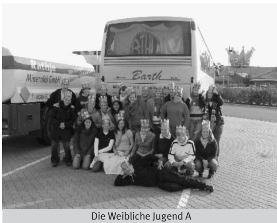
Die Weibliche Jugend A

BRUNO BERTHOLD · Holzgroßhandlung Königswinterer Straße 38 · 53227 Bonn Telefon 02 28-475031 · Fax 475273