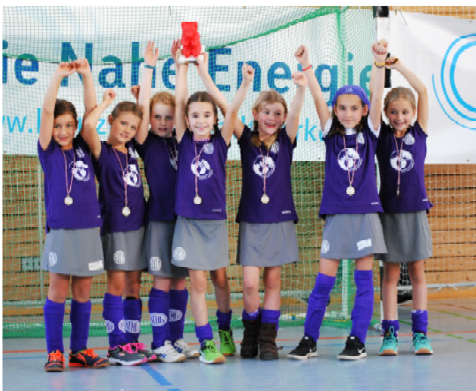
Mädchen D in Siegerpose