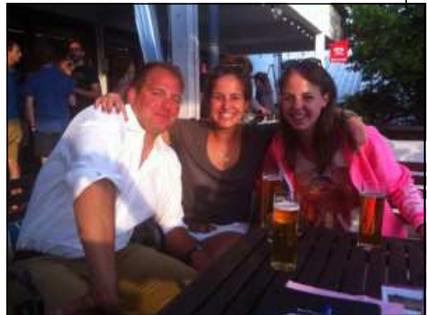
Cheftrainer weiblich und Co Trainerinnen - ebenfalls weiblich