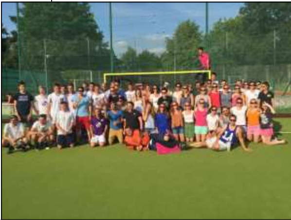
Die Party kann beginnen!