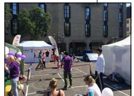
Es war viel los am Tennis-Stand!