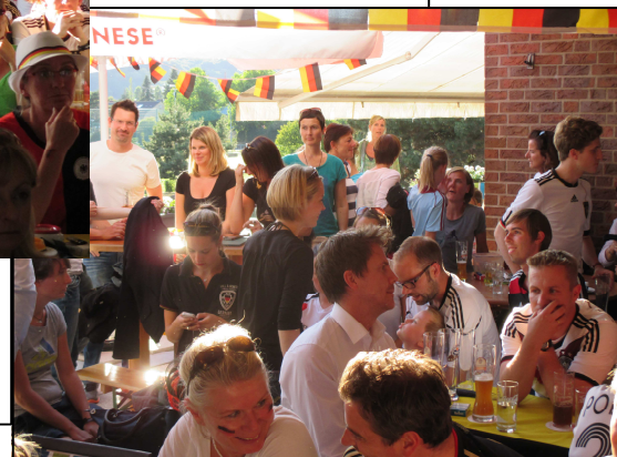
Die Halbzeitpausen wurden zu jede Menge Schnick-Schnack genutzt.