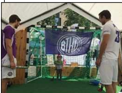
Tor, Tor, Tor!!